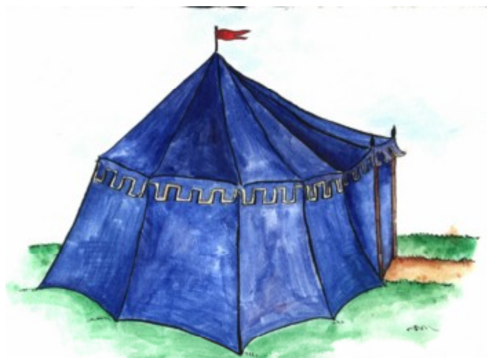
Iglú como palloza con techo de paja. Fases de construcción.- Iglú como tienda medieval.