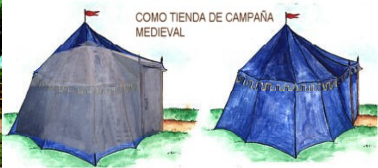
Iglú como palloza con techo de paja. Fases de construcción.- Iglú como tienda medieval.